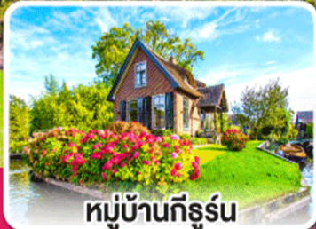
หมู่บ้านทีร์รัน