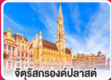
จัตุรัสกรองด์ปลาสต์