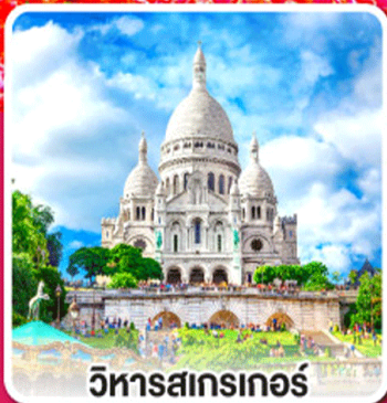
วิหารสกรเทอร์